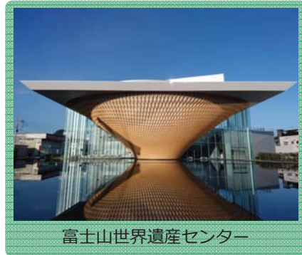
富士山世界遺産センター