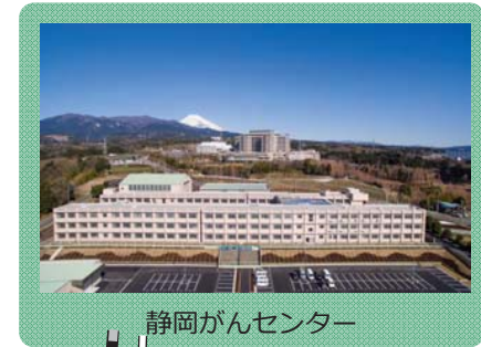
静岡がんセンター