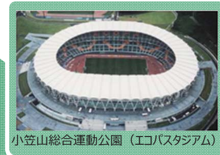
小笠山総合運動公園(エコスタジアム)