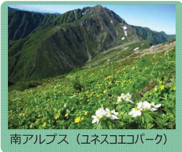
南アルプス(ユネスコエコパーク)